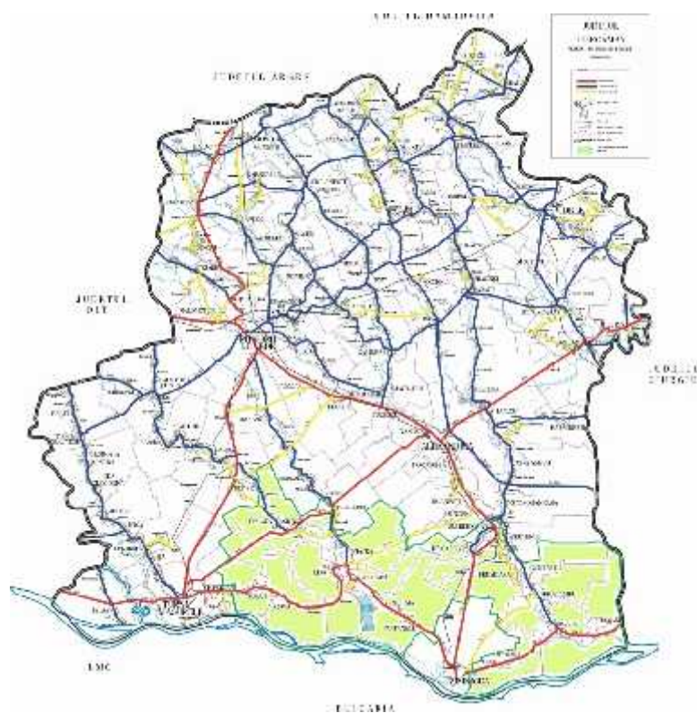
JUDEȚUL TELEORMAN 2016